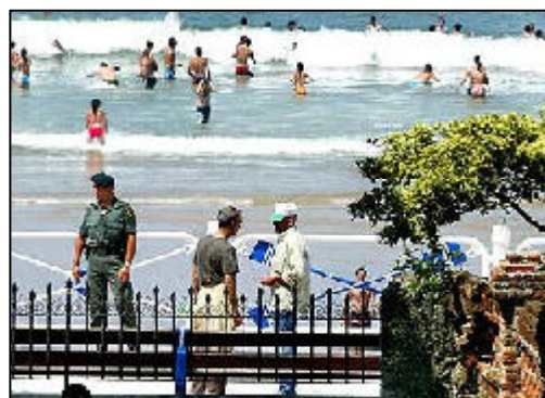
Agentes de la Policía Científica observan el lugar donde se produjo la explosión en Ribadesella.

Un hombre que dijo hablar en nombre de ETA avisó de la colocación de este arte-